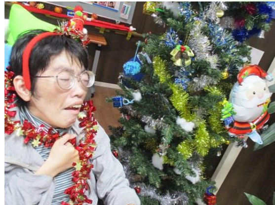
飾り付けもバッチリできました