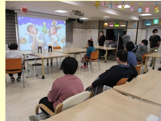
クリスマスの動画をみんなで楽しく見ました〜