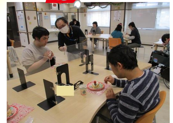
実はこの中にサンタさんがいるのです😊