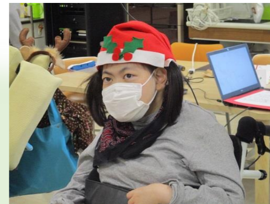
とてもかわいいサンタさん