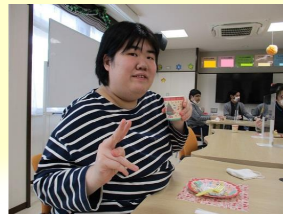
美味しかったですね〜👏