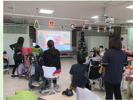
みんなでクリスマスの由来の動画を見ました。