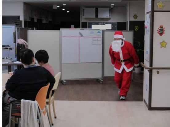
そ〜っとサンタさんが登場……。

3階生活介護フロアのクリスマス、サンタさんが来てくれました。来てくれた瞬間、職員が1名どこかへ行った気がしますけど、とっても盛り上がりました！