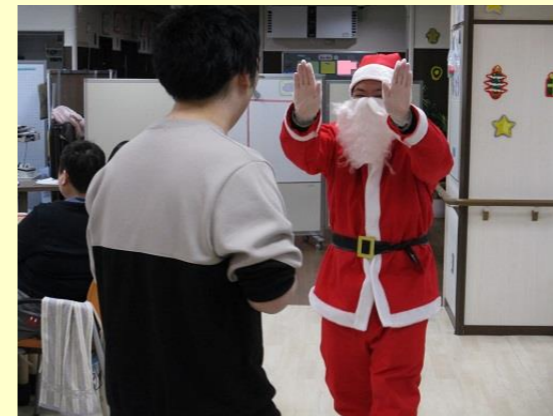
サンタさんとハイタッチ♪