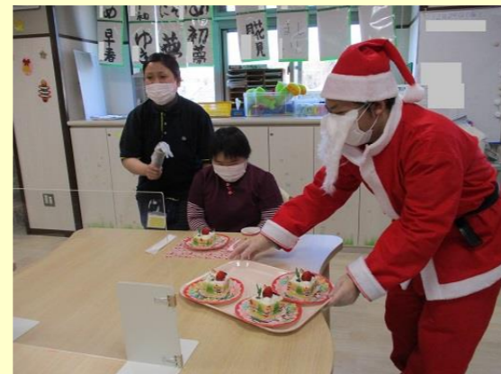
プレゼントのケーキを配る、まめなサンタさん