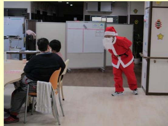
プレゼントをお持ちしましたよ