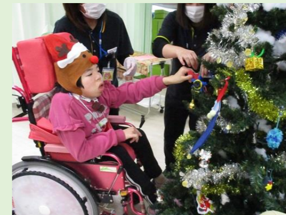
ここに飾りをつけてみましょうか