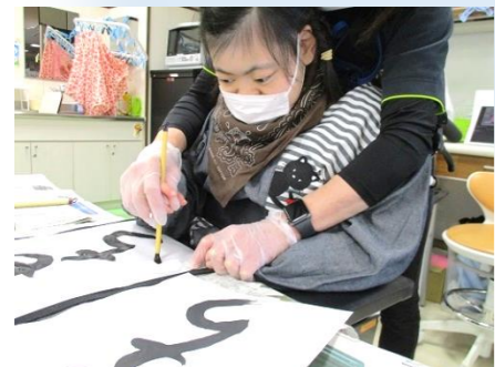
なかなかの腕前ですね