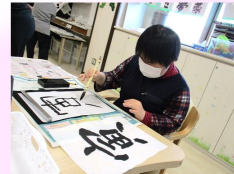
今年は寅年でした