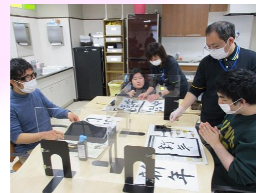
いいのが書けたら飾りましょうね〜♪