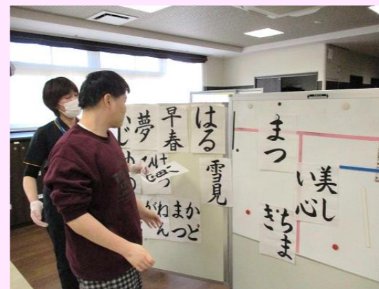
どれにしましょうか