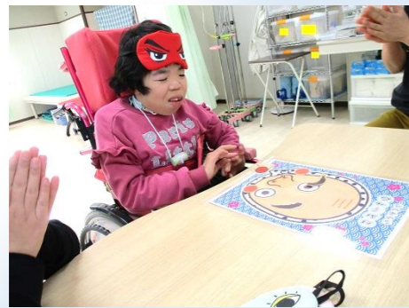
あれれ。下のほうによっちゃいました