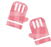
真剣に相談しているのになんか面白い…