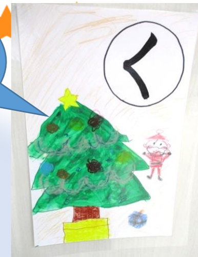
く リスマス 大きなツリーと サンタさん♪