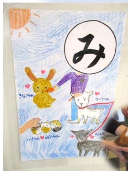
み んなでネ かわいいどうぶつ 触れ合った♪