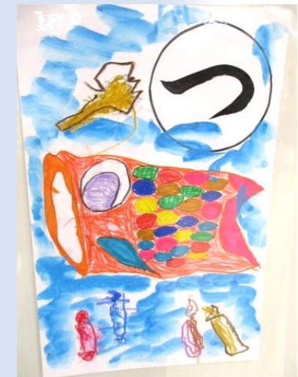
つ くったよ みんなで大きな こいのぼり♪