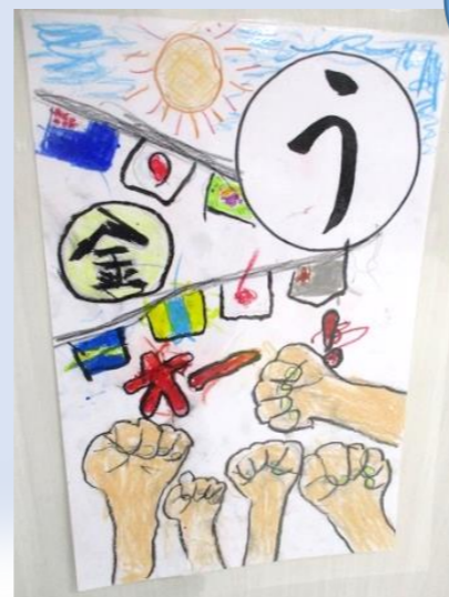
う んどうかい 優勝目指して えいえいおー！