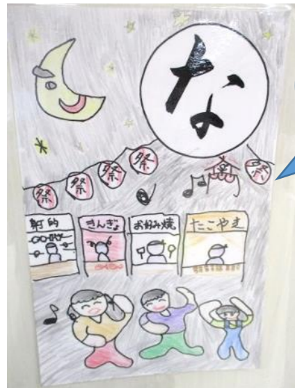
な つまつき 屋台や踊りを 楽しんだ♪

今回の愛光だよりでは、重心フロアでいま旬な活動、「かるた取り」のご紹介です！ かるたは冬だけのものではありませんよ～！ 自分たちで絵を描き、文章を考え、ラミネートして作成しました。1年通して楽しめるよう、いろんな季節の行事が書かれています。始まったらみんな真剣です(^_^)