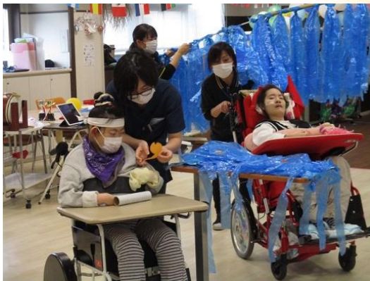
赤組と白組に分かれて真剣に戦いました～！

今回の愛光だよりは、各フロアで11月に行われた行事のご紹介です。 重心フロアは運動の秋にちなんで運動会、生活介護フロアは食欲の秋にちなんでデリバリーの昼食会を行いました！ それぞれのフロアで様々なアイデアを出してみんなで楽しみました。秋はとってもいい季節ですね♪