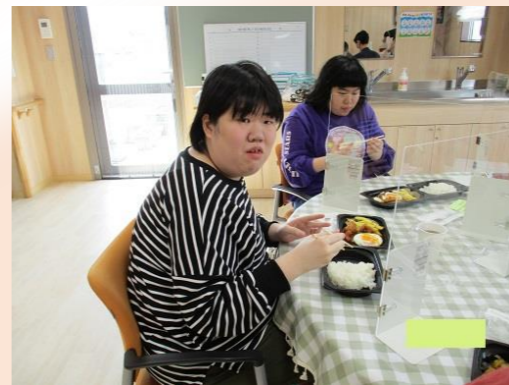
美味しそうな香りで食欲がわきますね