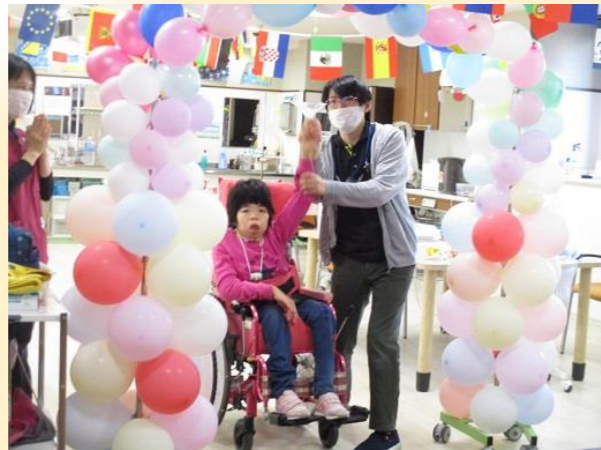
パステルカラーの風船アーチをくぐると元気な運動会の歌が聞こえてきました。はらぺこうさぎの玉入れゲーム、応援合戦、おさかな釣りリレー等、楽しみながらも真剣勝負です♪