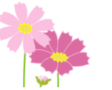
愛光の4階をテーブルクロスやお花で飾りつけをしてレストランの雰囲気を出しました。おしゃれBGMを流して、愛光レストランの出来上がり！