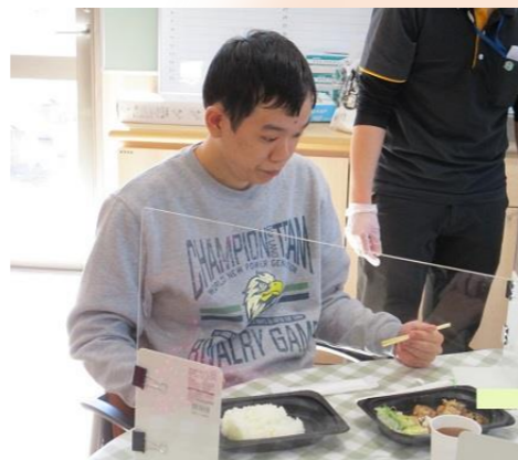
ご近所のファミリーレストランの宅配をお願いしました♪ あらかじめ好きなメニューを選んでいただいています