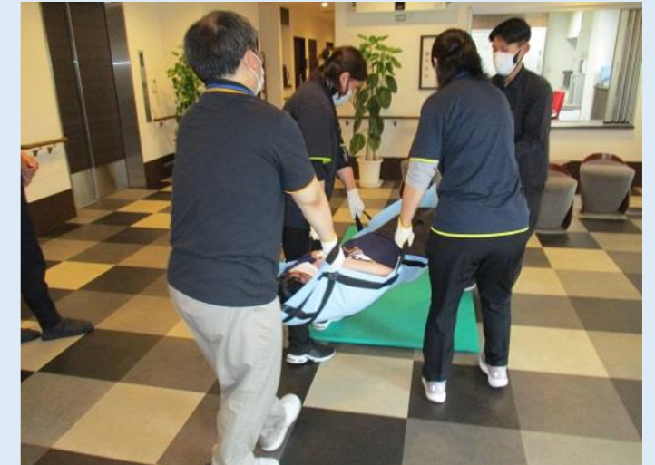
避難先は 1 階玄関ホールです