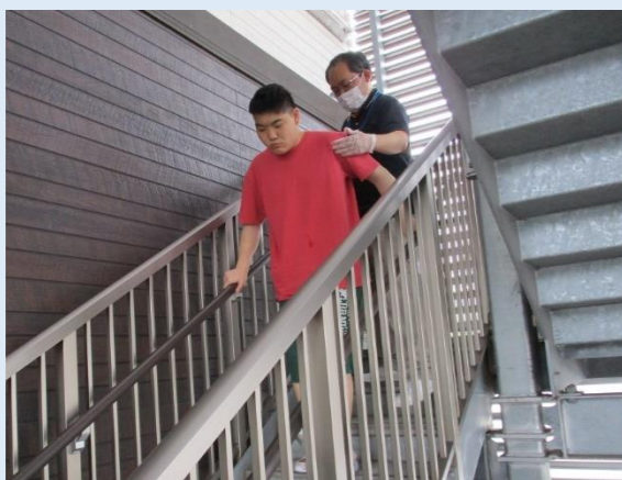
外階段を使う場合もあります。慌てずゆっくり降りましょう