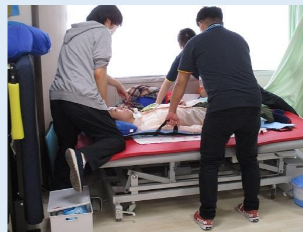
行きますよ～、せーのっ！