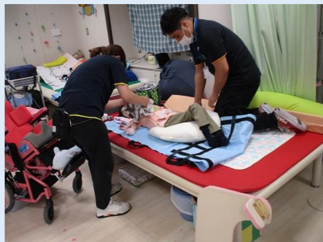
火事の想定での避難訓練！担架で移動します