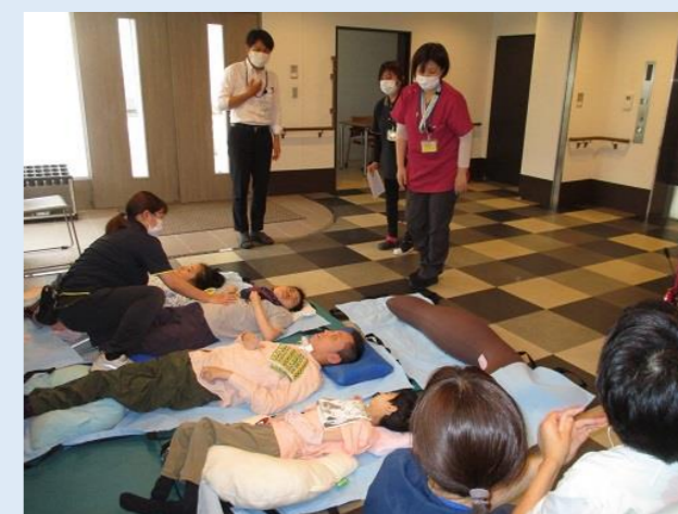
全員1階玄関ホールに避難完了！ 報告を行います