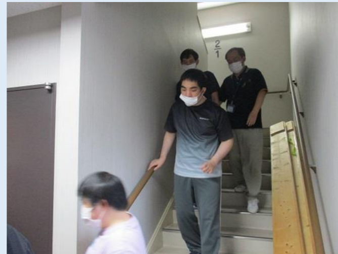
階段を下りられる方はスロープをわきに置き歩いて降ります