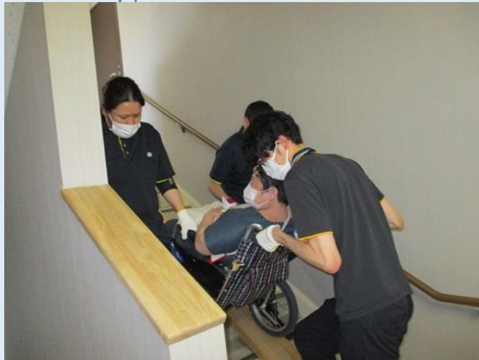
内階段に設置したスロープで車いすの方が避難します