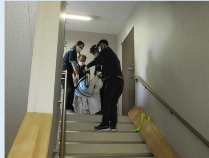
担架で降りられる方も