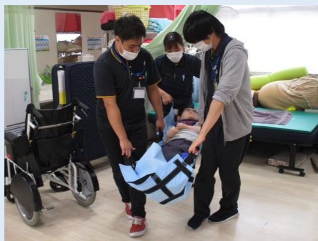
みなさま次々に避難していきます