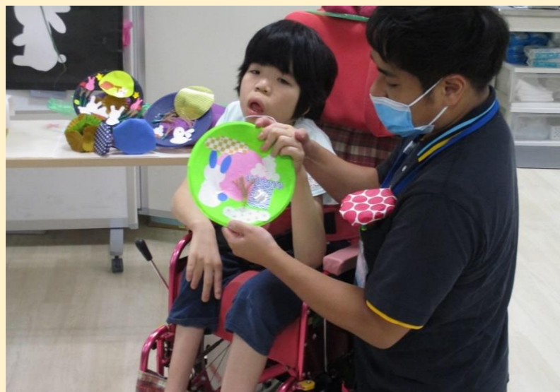
紙皿でお月見リースを作りました