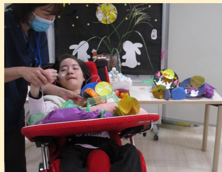
収穫した栗とさつまいもときのこを奉納します