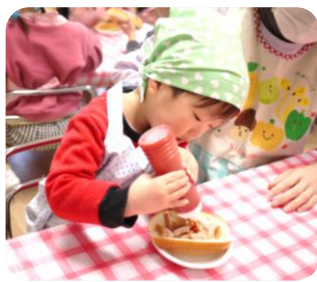
ホットドック 作ったよ

冬の冷たい寒さもやわらぎ少しずつ春の訪れを感じられるようになってきましたね。早いもので今年度も残り1か月となりました。残りの毎日大切に子どもたちと過ごしていきたいと思ひます。