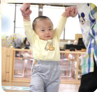
メダル もらったよ