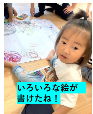
いろいろな絵が書けたね!