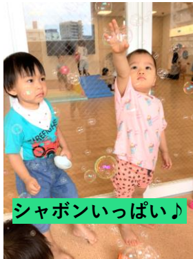
シャボンいっぱい♪