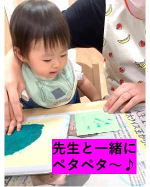
先生と一緒にペタペタ〜♪