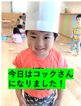
今日はコックさんになりました!