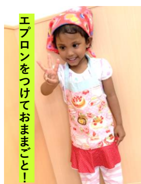
エプロンをつけておままごと!