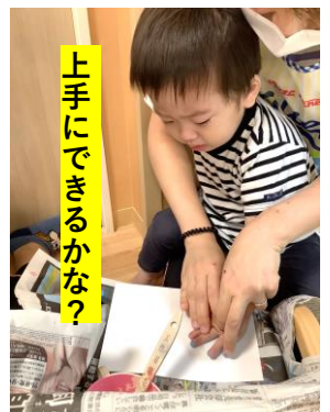
上手にできるかな?