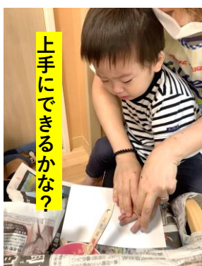
上手にできるかな?