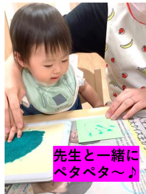
先生と一緒にペタペタ〜♪