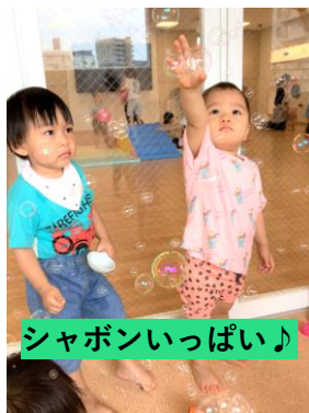
シャボンいっぱい♪