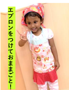
エプロンをつけておままごと!