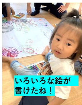
いろいろな絵が書けたね!