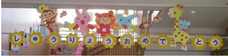
お別れの言葉・歌♪さよなら僕たちの保育園