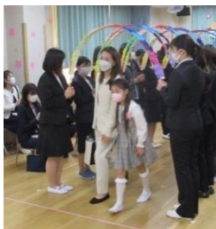
先生達のお花のアーチ