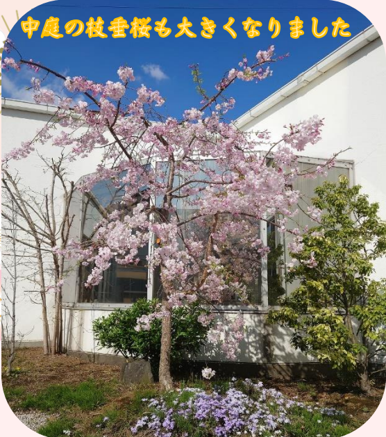
中庭の枝垂桜も大きくなりました