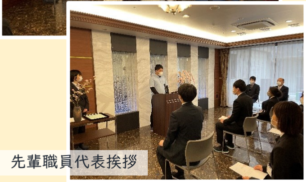
先輩職員代表挨拶