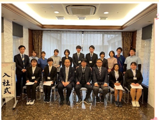
令和3年度 高齢介護事業部 新卒入社式

4月1日、親光に新卒職員6名が入社しました。これから様々な研修を重ね、立派な介護職員として入居者様をケアできるようしっかりと育成を行ってまいります。