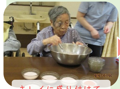
キレイに盛り付けて