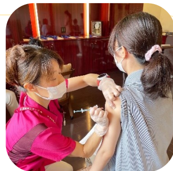
職員ワクチン接種の様子

また、6月におきましては全職員が2回PCR検査を実施しており、いずれもすべて陰性となっております。引き続き手洗い・うがい、消毒などを徹底し感染予防に努めて参ります。