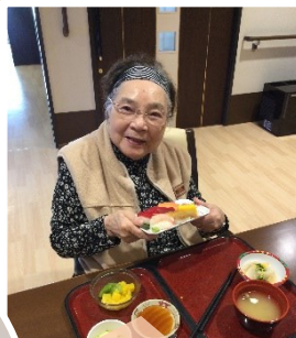
おかわりもたっぷり 用意してます!