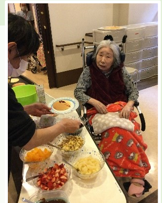
職員が焼いたパンケ ーキに入居様のお好み でフルーツや生クリ ームをのせて完成!