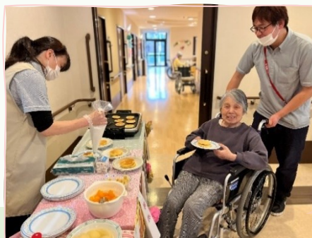
焼きたてのパン ケーキは大好評 でした!!