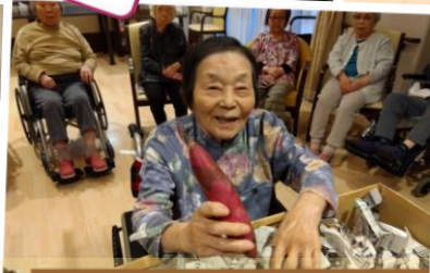
さつま芋掘りの様子