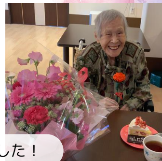
101歳と102歳のお誕生日を迎えた入居者様をお祝いしました！