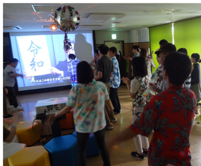
東光の1年をQUEENの曲に乗せスライドショーで振り返ります。中には感涙する職員の姿も。