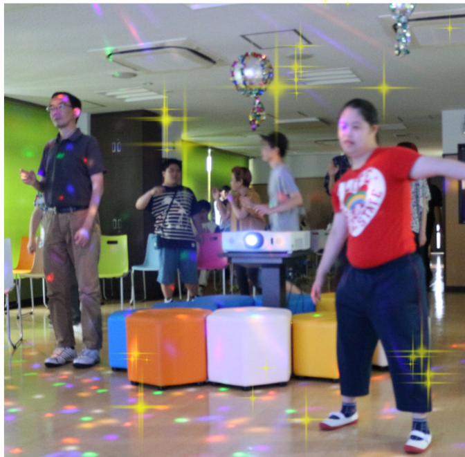
ミラーボールが輝くダンスフロア。納涼祭のメインイベントであるダンスタイムでは昭和～平成～令和の名曲を歌い、踊り、感動のフィナーレを迎えました

2階フロアでは喫茶「スナックのみ子」を開催。去年行った文化祭の「スナックいずみ」の魂を引き継ぐ形での出店となりました。メニューには定番の焼きそば、フランクフルトに加えて、オリジナルブレンドのペビーカステラを提供。職員が試作に試作を重ね、たどり着いた究極の味を一口味わおうと行列が絶えませんでした。