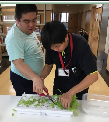
今回はレタスを栽培して収穫しました。季節に応じて様々な野菜を作っています。