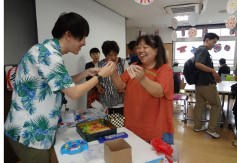
ご家族、ヘルパーさん、学校の先生方にもお越しいただき、皆様のご協力で納涼祭は大成功に終わりました！