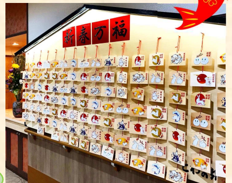
玄関ロビーの絵馬かけ