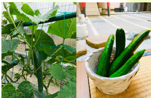
『とわ農園』では美味しいきゅうりが育ちました♪