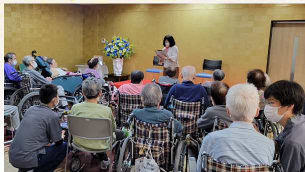
施設長より敬老の日のお祝いのご挨拶からスタートしました

三味線ライブは1階交流スペースにて公演回数を3回に分けて演奏していただきました。二人の津軽三味線の演奏は迫力満点!! 三味線の音色が心に響き、普段は音や声掛けに反応が薄い方もリズムを取るようなくさや手拍子をされたり、皆さんが感動されていて涙を流す方もいらっしゃいました。