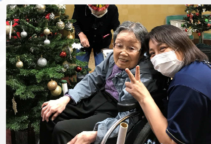
写真撮りま〜す! はいピース♪