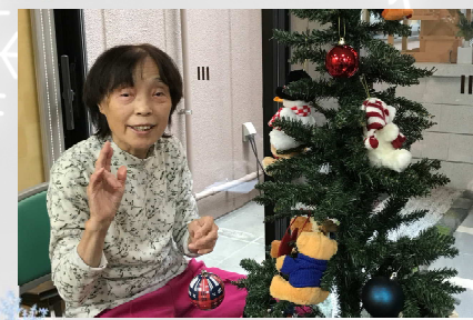
ツリーできたよ♪ハイポーズ!!