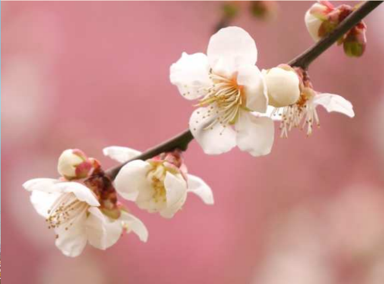
とわの郷の垣根の向こうに見える梅の木 ~良い香りがします~