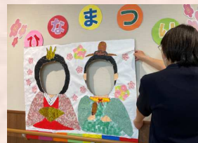
←スタッフが作った顔出しパネル!

3月3日頃には、ひな祭りレクが開催されるユニットもありました。お内裏様とお雛様がのった可愛いケーキを食べたり、カラオケで歌を歌ったり、お雛様の衣装を着て写真撮影をしたりして、季節行事を楽しまれていました。