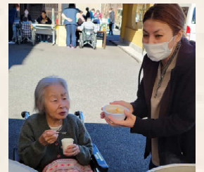
ドライバー岡田&カマサ板