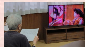
カラオケでひな祭りの曲など、皆さん一緒に歌いました♪