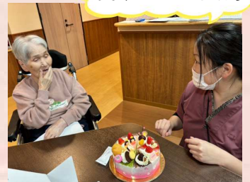
美味しそうですね♪