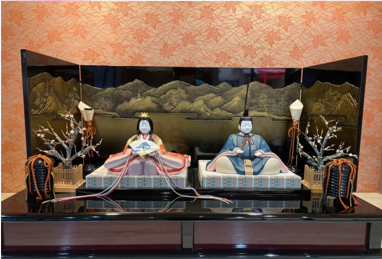
とわの郷では今年は京雛飾りでお雛様は向かって左側に飾られました