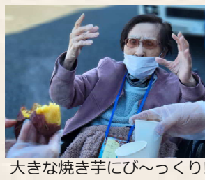
大きな焼き芋にび〜っくり!!