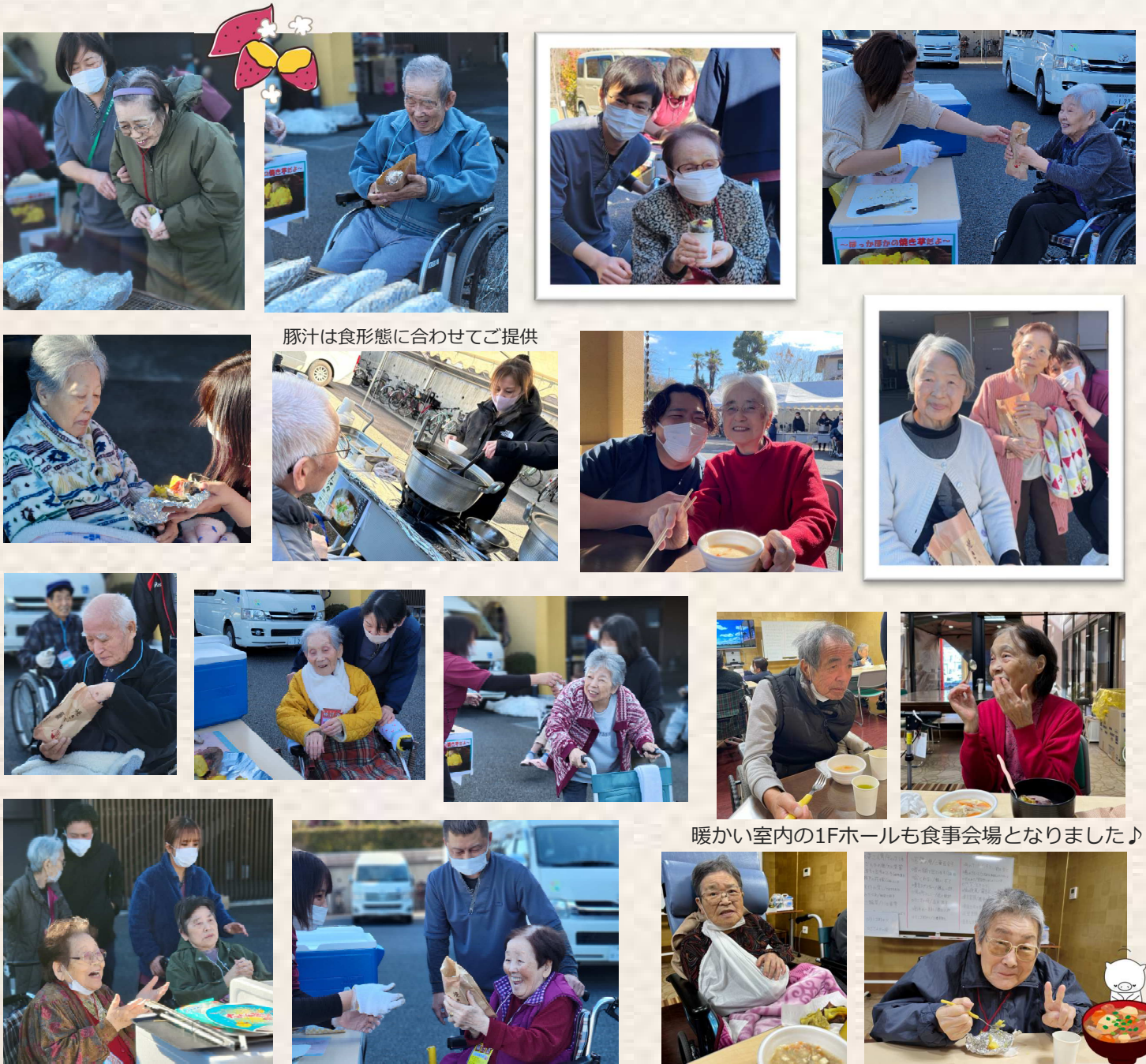
豚汁は食形態に合わせてご提供