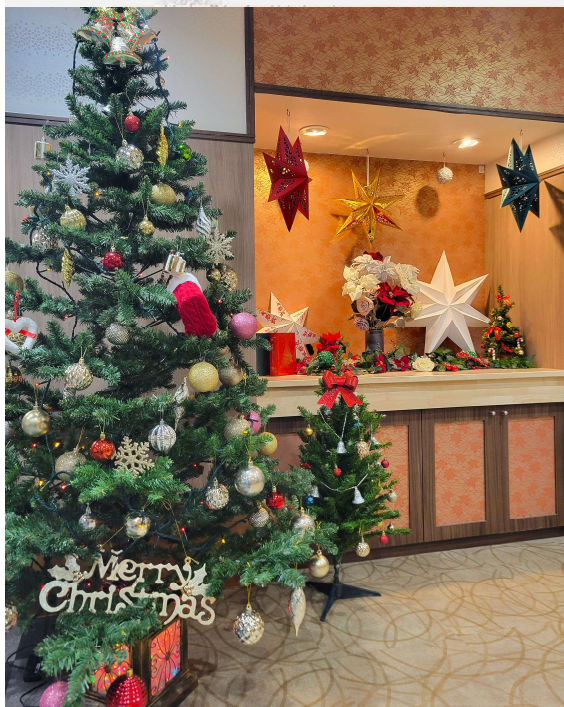
X'mas一色となったとわの郷のエントランス