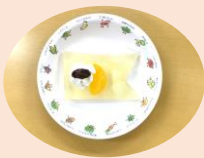
「こいのぼり ゼリー」

みんなが大好きな おやつ時間です。 毎日おいしい給食 を食べています (#^.^#)